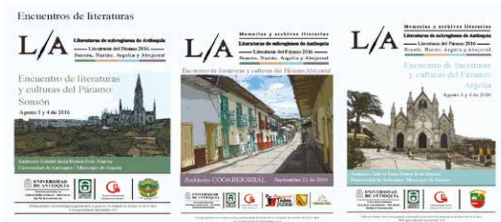
Figura 2. Memorias y archivos literarios.