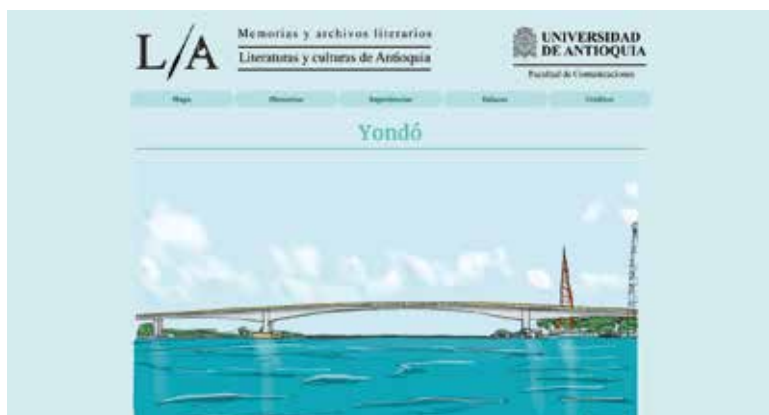
Figura 6. Portal municipio de Yondó. Diseño Juan Camilo Ramírez Ortiz