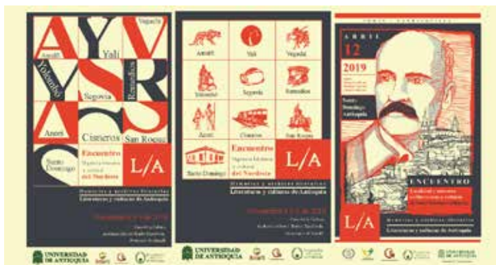
Figura 4. Literaturas del Nordeste. Encuentros de literatura.