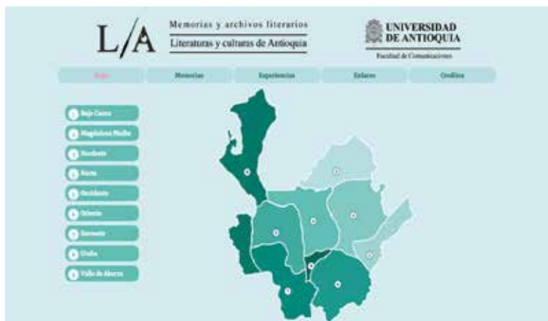
Figura 5. Páginas web municipios de Antioquia. Diseño Juan Camilo Ramírez Ortiz