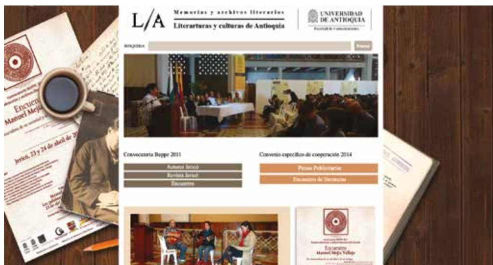
Figura 1. Convenio UdeA-Jericó. www.jericopatrimonial.com.co/ . Diseño: Juan Camilo Ramírez Ortiz.

universitarias y nacionales de diversos países, indicando de este modo, la divulgación internacional de la obra de Mejía Vallejo. Se presentan alrededor de 535 registros ordenados cronológicamente a partir 1945, fecha de publicación de La tierra éramos nosotros , su primera obra. En esta relación El día señalado es una de las obras de mayor impacto, en 1964 por ejemplo, la Editorial Destino puso en circulación cinco ediciones de la obra. Igualmente, se compilan repertorios bibliográficos y documentales que muestran la variada recepción a la obra de este autor, la cual va desde tesis de doctorado, trabajos de maestría y monografías de pregrado; investigaciones, diversos tipos de estudios hasta realizaciones de televisión y cine, notas periodísticas y divulgación en páginas web. En toda referencia se agrega el lugar de localización de la fuente de información atendiendo al derecho de citación; lo cual muestra, entre otros contenidos, que la Biblioteca Pública Piloto de Medellín para América Latina se manifiesta como la depositaria natural de la obra del escritor de Jericó y la Universidad de Antioquia la investigadora permanente en vida y tras la muerte del autor. Los resultados de este capítulo amplían el patrimonio literario del municipio de Jericó y hacen parte del componente bibliográfico del “Micrositio Manuel Mejía Vallejo” en el portal http://www.jericopatrimonial.com.co/ .